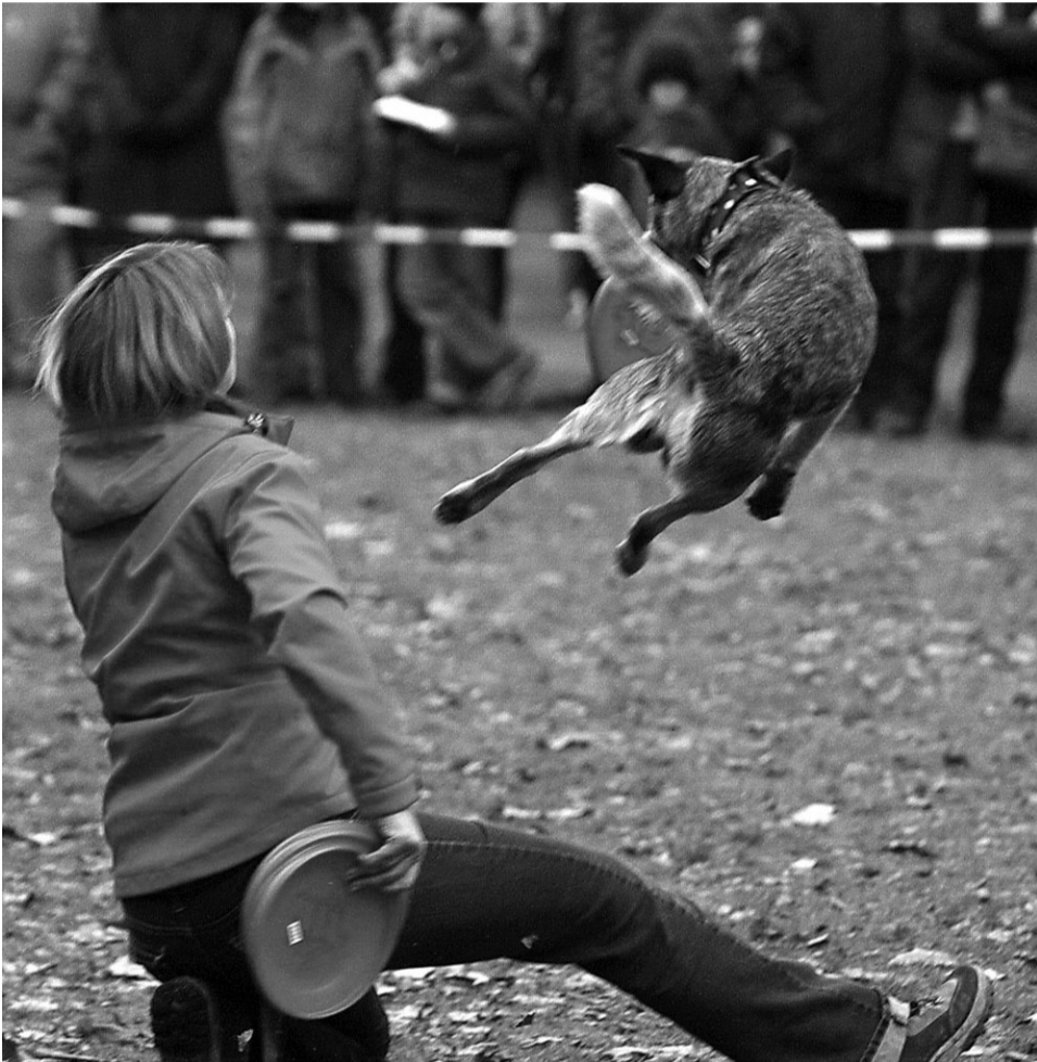
Frisbee-Meister: Den athletischen Umgang mit der Wurfscheibe demonstrierten Hunde im Vorprogramm der Wolfsheulnacht.