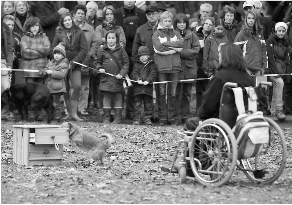
Publikumsbeliebte: Behinderten-Begleithunde zeigten ihre erstaunlichen Fähigkeiten wie das Herausnehmen von gewünschten Objekten aus Schubladen.